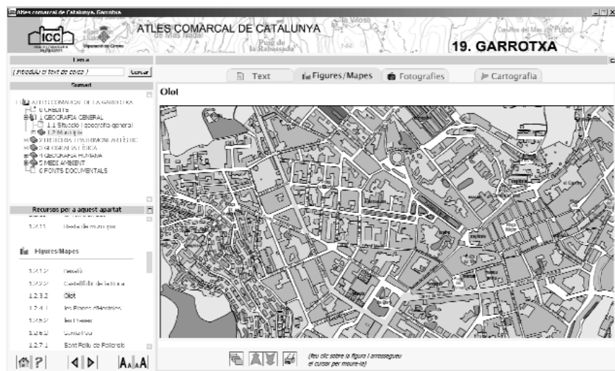
Figura 2. Mostra de planimetria urbana elaborada per als atles.

a escala 1:8.000. Els mapes s'han realitzat a partir de la informació planimètrica del Mapa Topogràfic de Catalunya 1:5.000 (ICC) i s'han complementat amb la informació de l'Ortofotomapa de Catalunya 1:25.000 (ICC), fotogrames dels vols dels anys 2004 i 2005 (ICC) i informació recollida als ajuntaments. Els nous mapes actualitzen la informació de base municipal a una escala amb molt de detall, a manera de planimetries urbanes, i, fins i tot, en els casos dels municipis petits, són un treball inèdit que supera les aportacions de les geografies generalistes preexistents, centrades gairebé exclusivament en les capitals comarcals i els nuclis de més dinamisme.