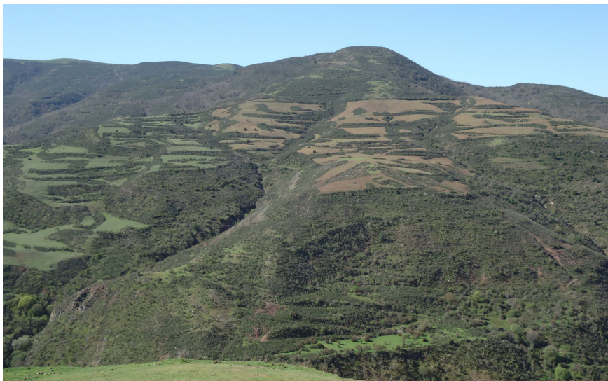
Figura 4. Imagen tras el desbroce de matorrales en una ladera de Soto en Cameros (Valle del Leza).