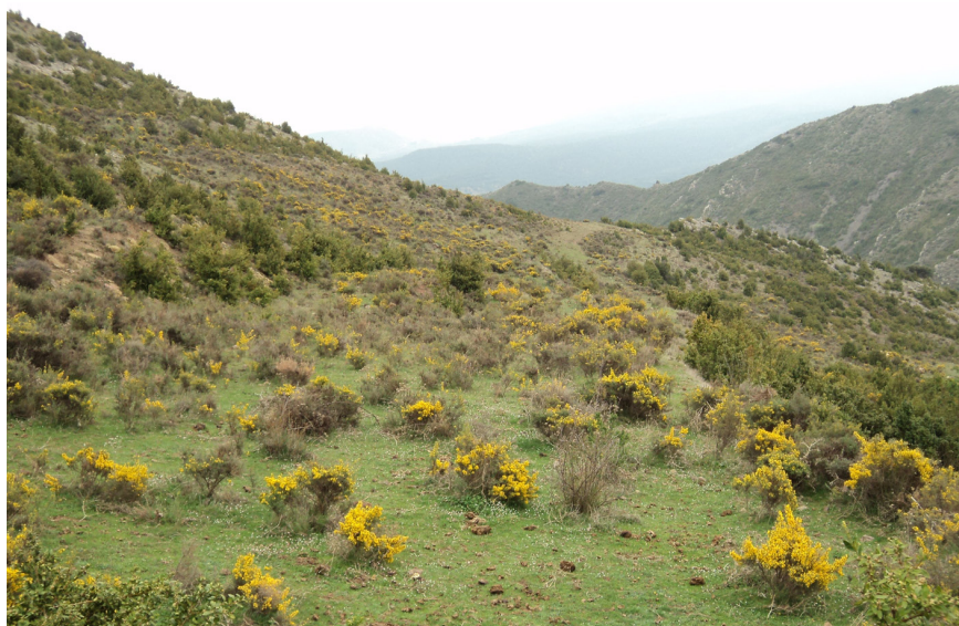
Figura 3. Colonización vegetal por Genista scorpius en la aldea de San Martín (Valle del Jubera).