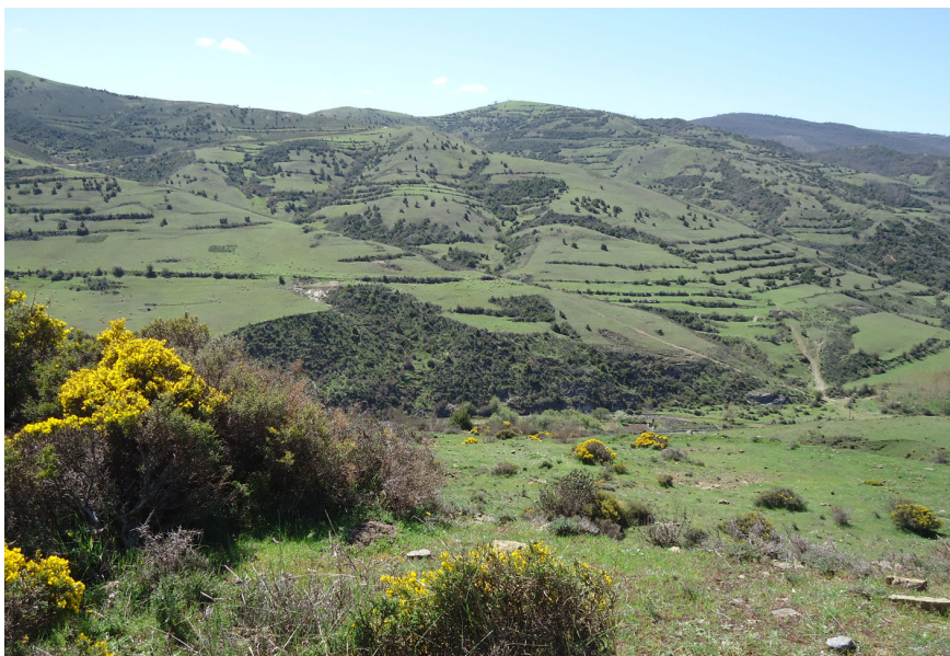
Figura 5. Ladera desbrozada de matorrales en Jalón de Cameros (Valle del Leza).