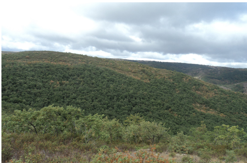
Figura 2. Revegetación de bosque natural en la aldea de San Martín (Valle del Jubera).