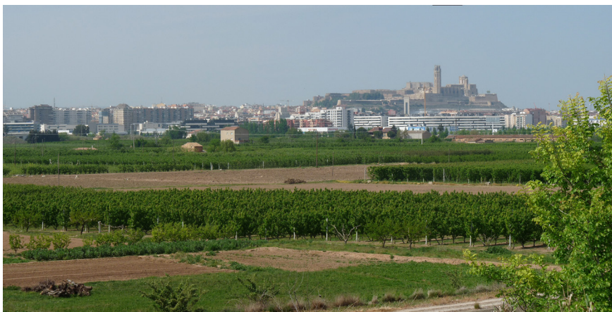
Figura 1. Vista aèria de l'Horta de Lleida.