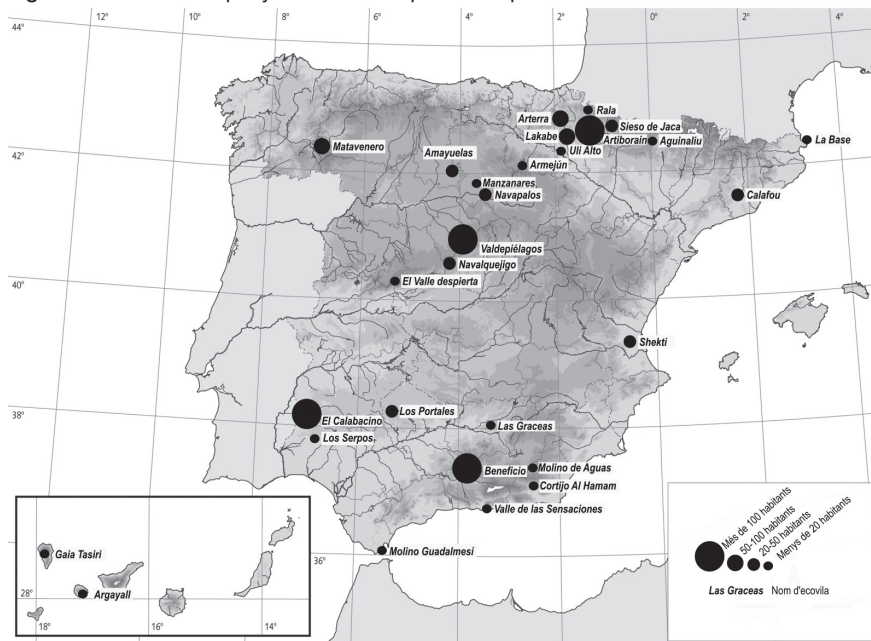
Figura 2. Ecoviles a Espanya amb la seva població aproximada